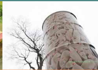
野外×アート(善福寺公園)