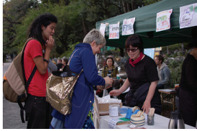
ラジオばちばちオープンカフェ