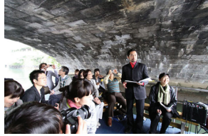
「名橋たちの音を聴く」/音のつむ森に捧ぐ! 開演プロジェクト