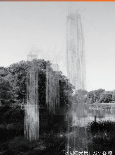
「水辺の光景」池ヶ谷 務